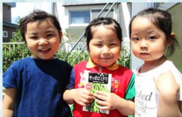
えだまめ だいすき♡

5月17日、枝豆の種をまきました。さやに入った枝豆を知る子どもたちは、まん丸の種を見てびっくりした様子。園長先生から種の植え方を教わり、おいしい枝豆ができるように願いながら植えていました！