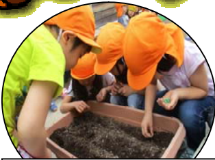
枝豆種まき。夢中です

苗のにおいを嗅いで、「トマトの臭いがする〜!!!」と言っている子がいて、「え？ほんと？???」と鼻をくっつけている姿も。「しないよ〜?」「いや、した!」など会話ははずんでいます。じゃがいも、えだまめもちゃんと発芽しますように。